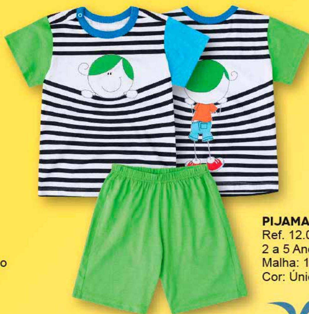
PIJAMA MM Ref. 12.01.0183 2 a 5 Anos Malha: 100% Algodão Cor: Única