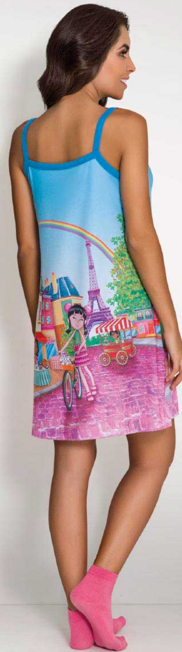
CAMISOLA DE ALÇA Ref. 10.02.0188 PP ao XG Poliéster Cor: Única