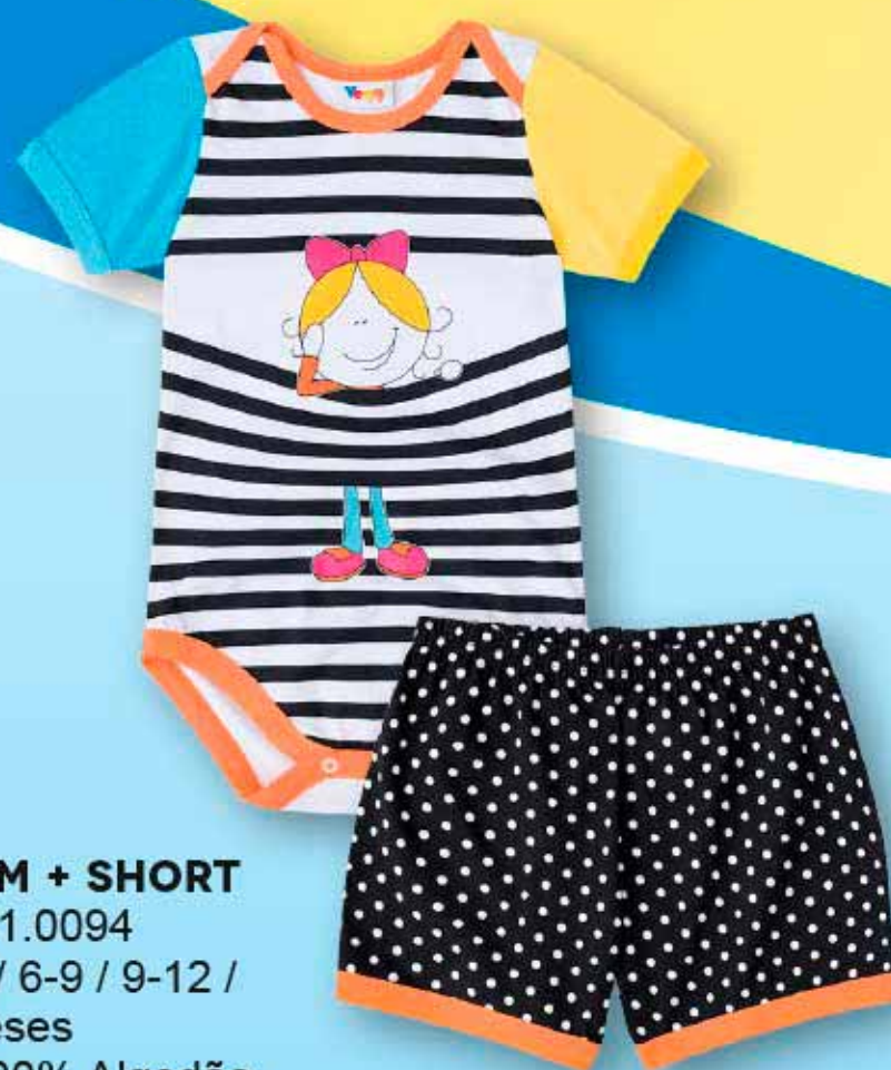
BODY MM + SHORT Ref. 13.01.0094 0-3 / 3-6 / 6-9 / 9-12 / 12-18 Meses Malha: 100% Algodão Cor: Única