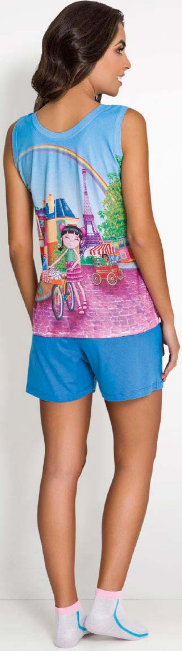
PIJAMA REGATA Ref. 10.01.0250 PP ao XG Blusa Poliéster / Short Algodão Cor: Única