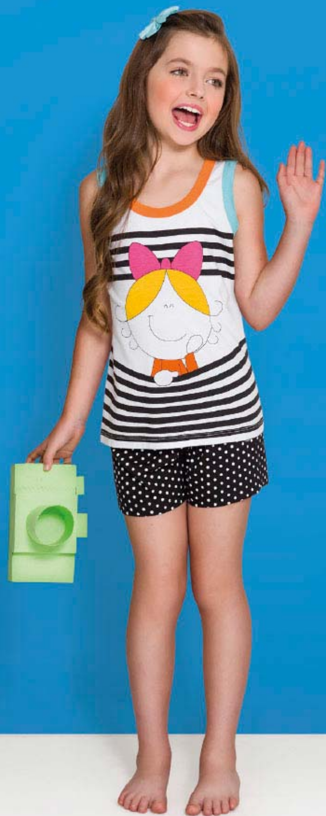
PIJAMA REGATA Ref. 11.01.0184 6 a 14 Anos Malha: 100% Algodão Cor: Única