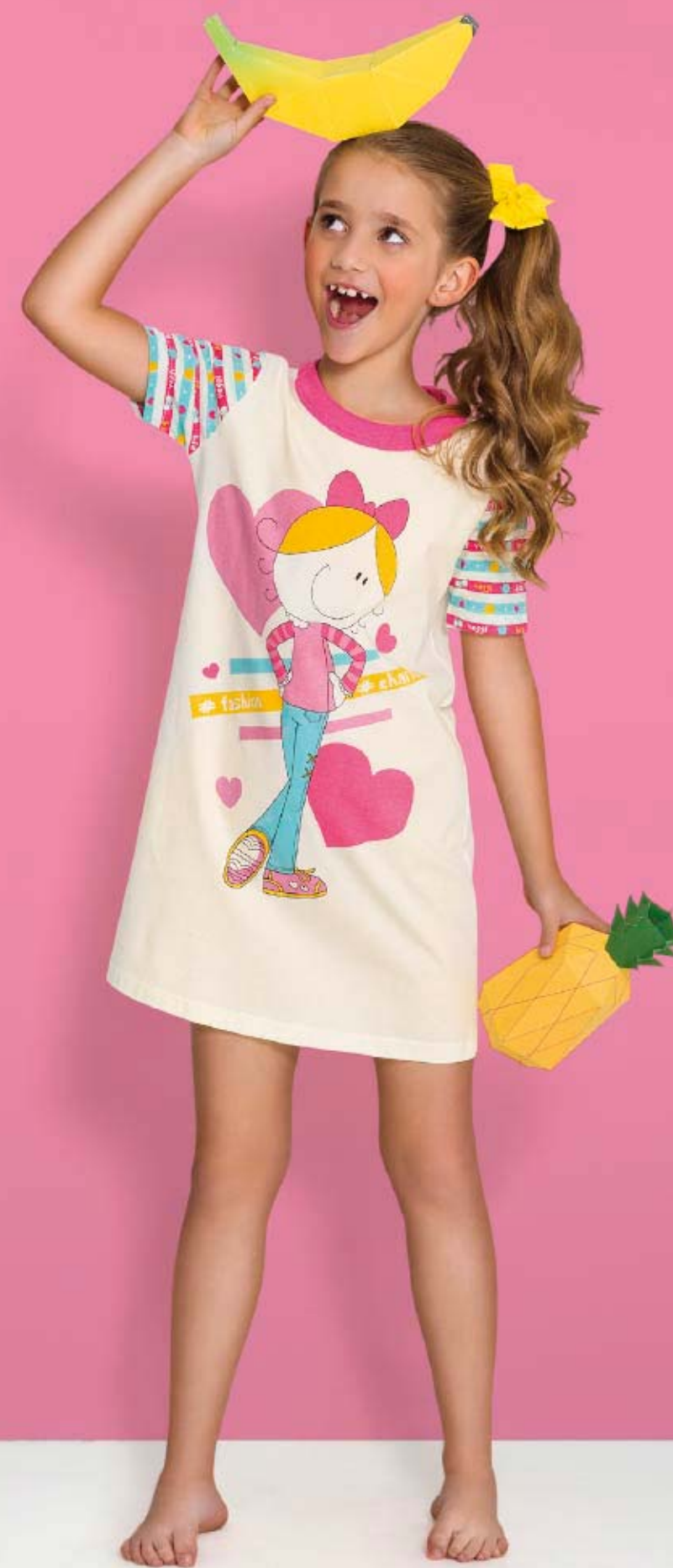
CAMISOLA MM Ref. 11.02.0072 6 a 14 Anos Malha: 100% Algodão Cor: Branco / Marfim