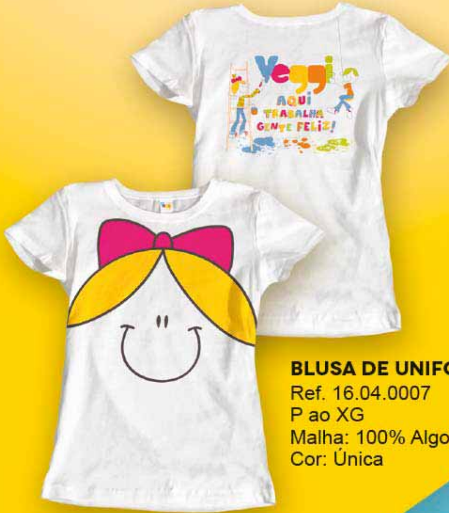
BLUSA DE UNIFORME Ref. 16.04.0007 P ao XG Malha: 100% Algodão Cor: Única