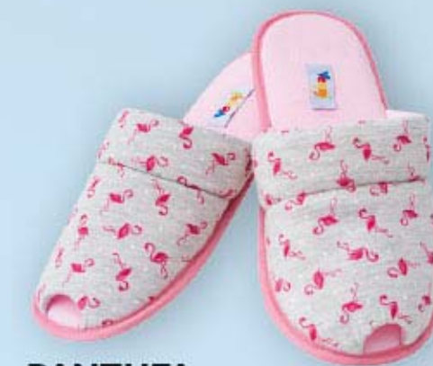
PANTUFA Ref. 16.11.0024 33/34 - 35/36 - 37/38 - 39/40 Malha: 100% Algodão e Mescla Cor: Única