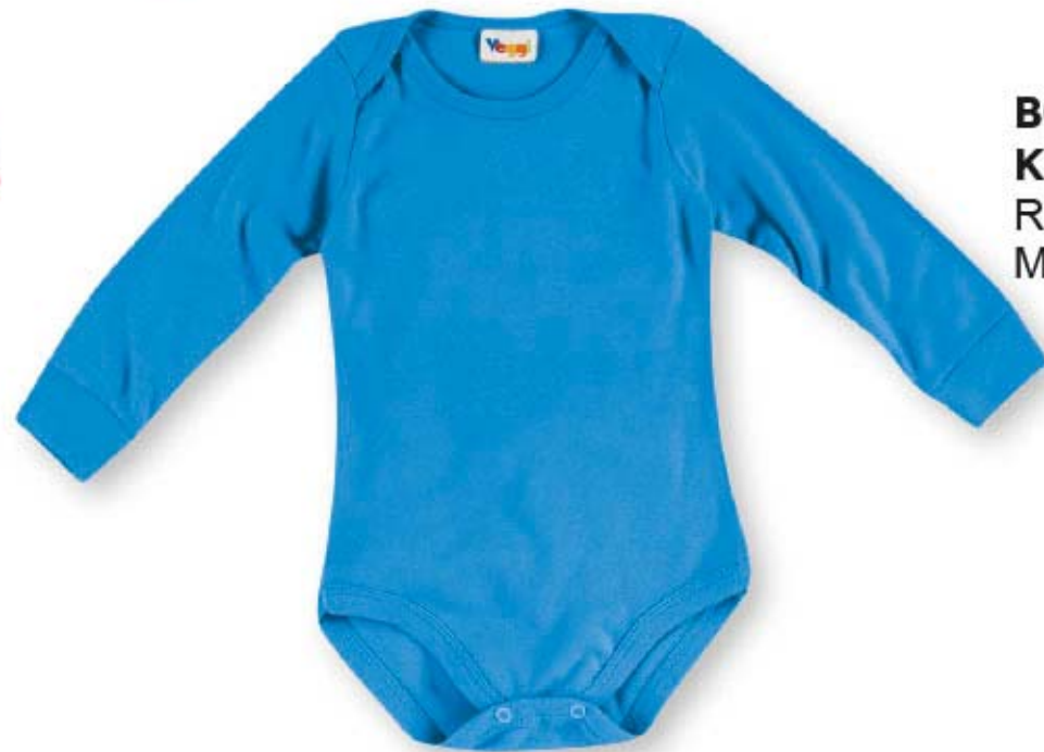
BODY ML KIT COM 2 Ref. 13.05.0049 Malha: 100% Algodão