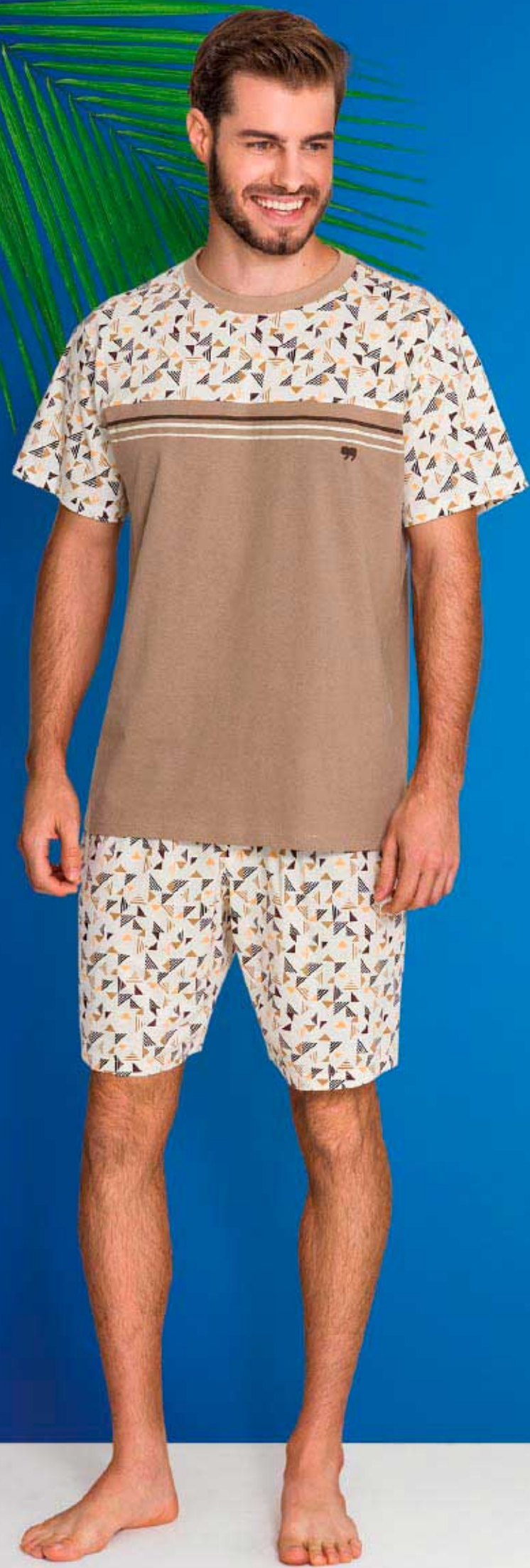
PIJAMA MM Ref. 10.01.0253 P ao XG Malha: 100% Algodão Cor: Azul / Marrom