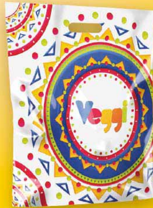
SACOLA DE PLÁSTICO Ref. 16.04.0011 A: 36 cm / L: 40 cm / P: 07 cm Cor: Única Kit com 20