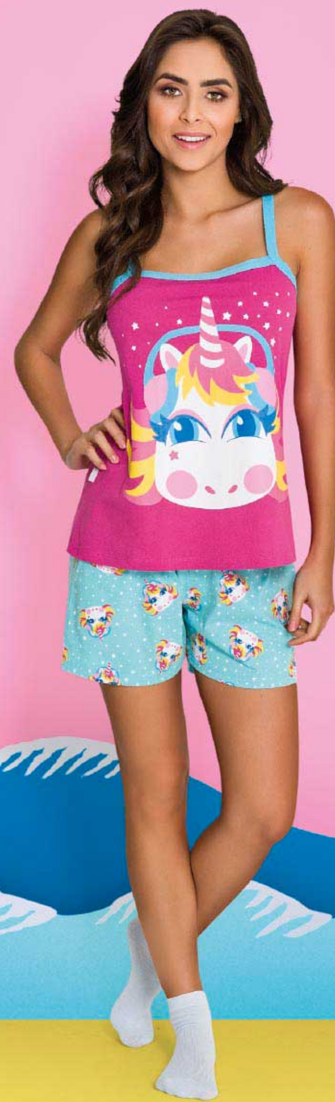
PIJAMA DE ALÇA Ref. 10.01.0245 PP ao XG Malha: 100% Algodão Cor: Única