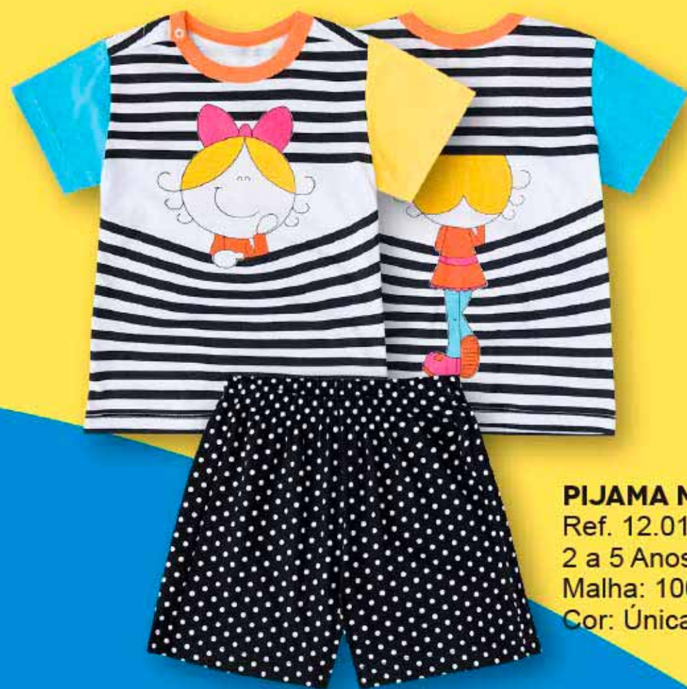
PIJAMA MM Ref. 12.01.0181 2 a 5 Anos Malha: 100% Algodão Cor: Única