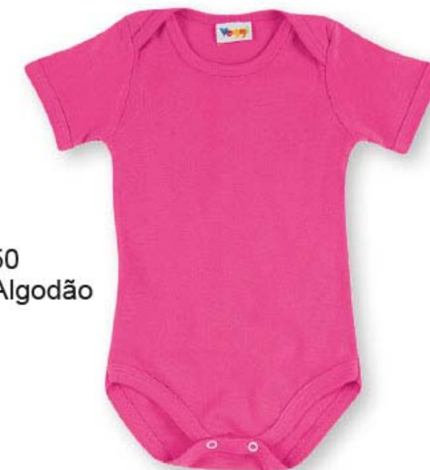
BODY MM KIT COM 2 Ref. 13.05.0050 Malha: 100% Algodão