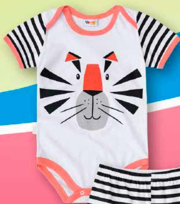
BODY MM + SHORT Ref. 13.01.0092 0-3 / 3-6 / 6-9 / 9-12 / 12-18 Meses Malha: 100% Algodão Cor: Única