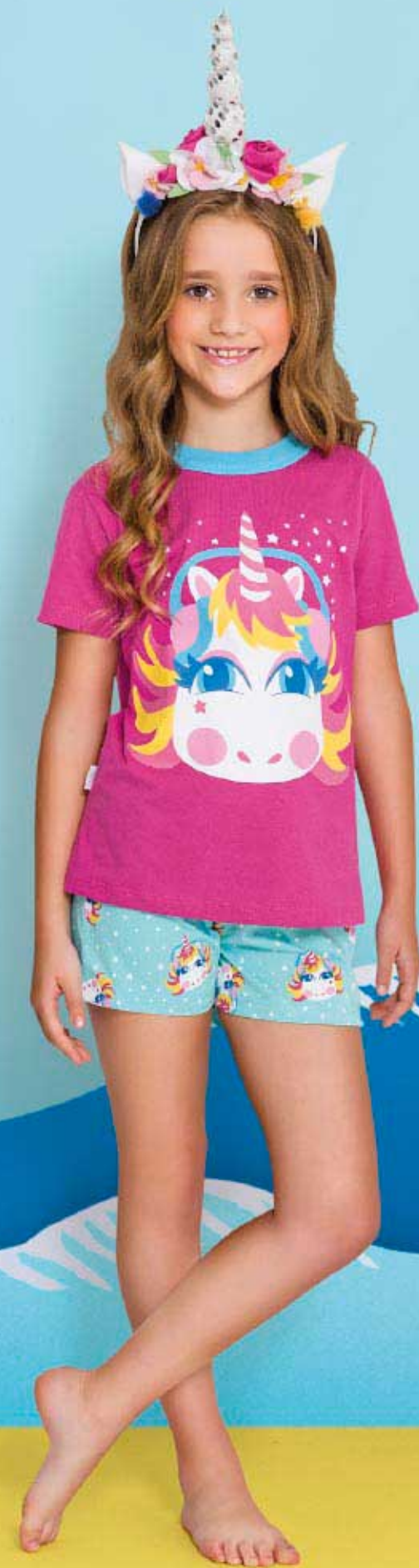
PIJAMA MM Ref. 11.01.0196 6 a 14 Anos Malha: 100% Algodão Cor: Única