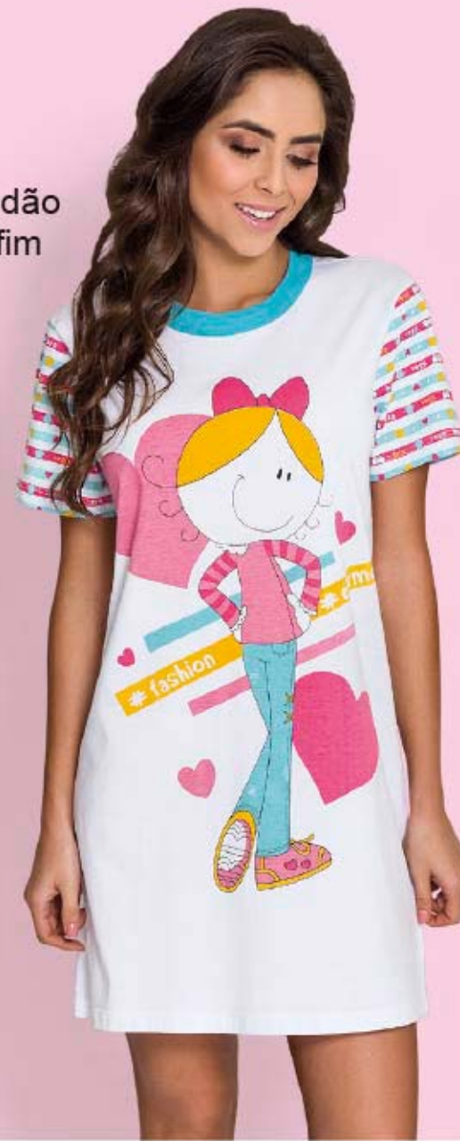
PIJAMA DE ALÇA Ref. 10.01.0242 PP ao XG Malha: 100% Algodão Cor: Branco / Marfim