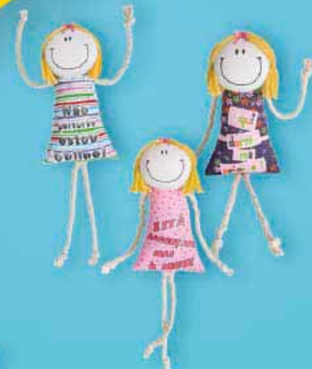
KIT COMANDO DE PORTA BIA Ref. 16.10.0008 Cor: Única