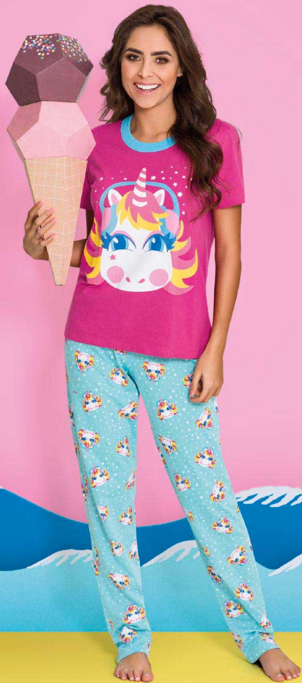
PIJAMA MM Ref. 10.01.0255 PP ao XG Malha: 100% Algodão Cor: Única