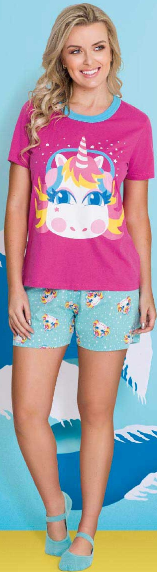
PIJAMA MM Ref. 10.01.0240 PP ao XG Malha: 100% Algodão Cor: Única