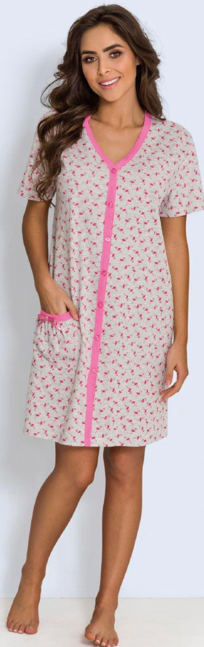
CAMISOLA MM ABERTA Ref. 10.02.0185 P ao XG Malha: Mescla Cor: Única