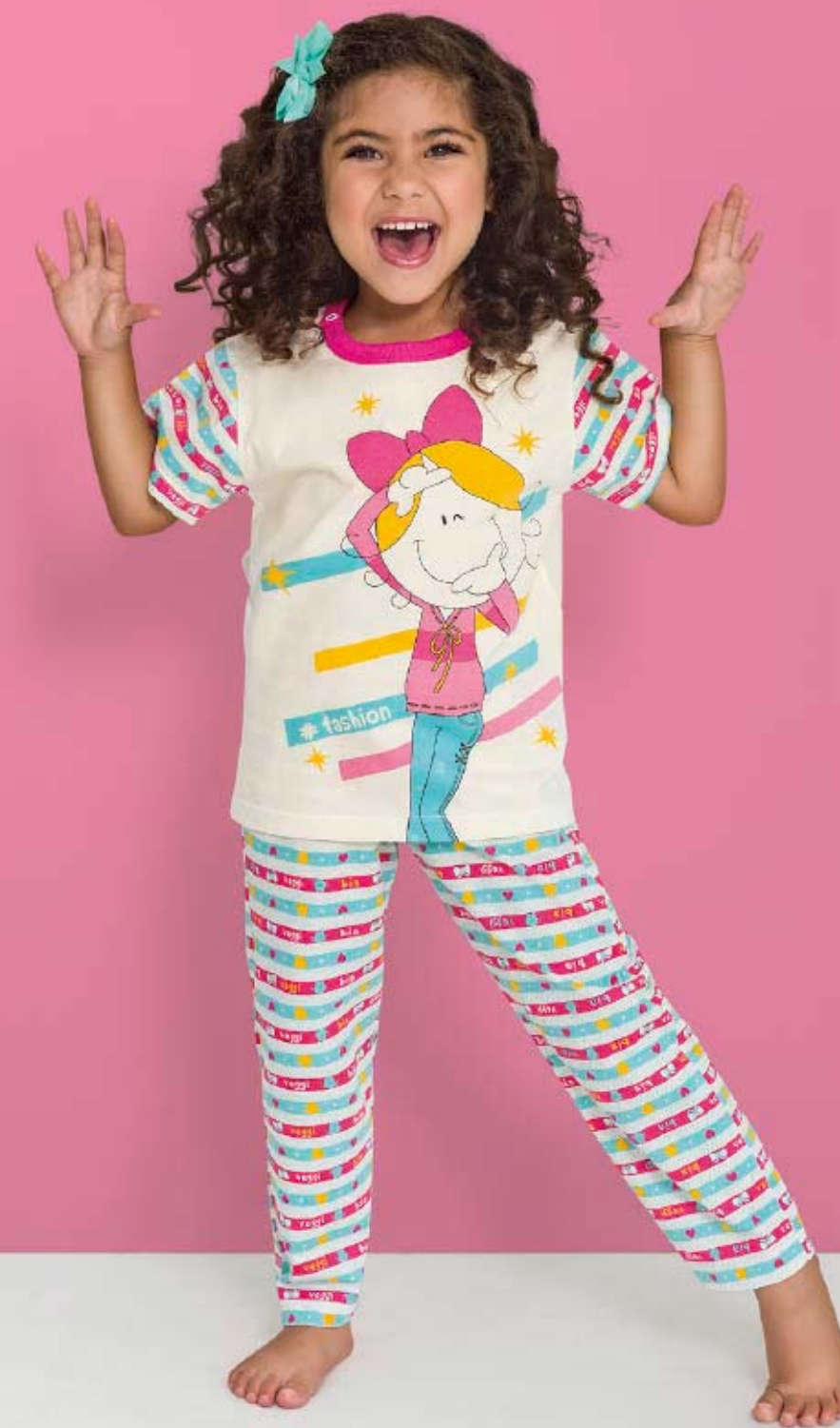
PIJAMA MM Ref. 12.01.0187 2 a 5 Anos Malha: 100% Algodão Cor: Branco / Marfim