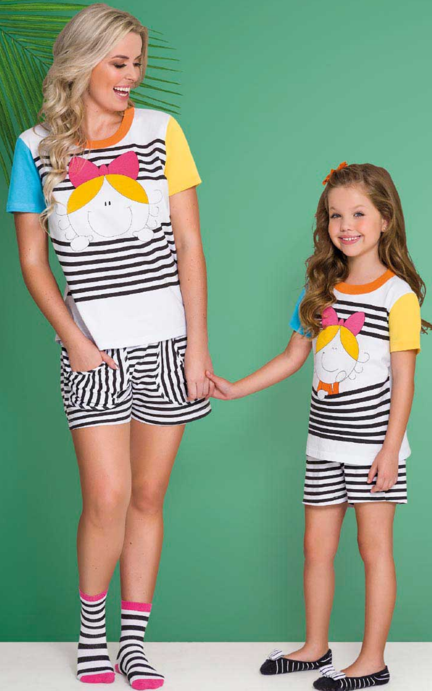
PIJAMA MM Ref. 10.01.0231 PP ao XG Malha: 100% Algodão Cor: Única