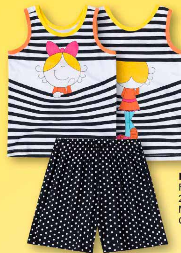
PIJAMA REGATA Ref. 12.01.0182 2 a 5 Anos Malha: 100% Algodão Cor: Única