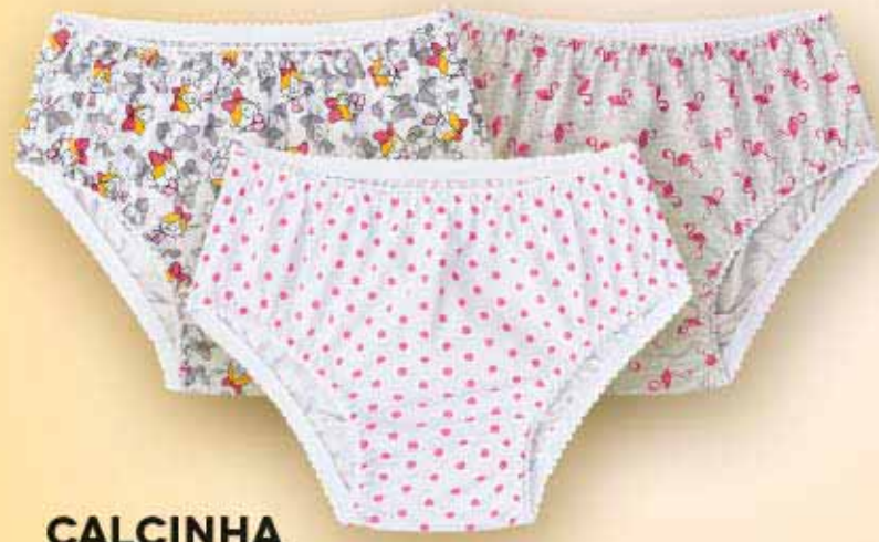
CALCINHA KIT COM 3 Ref. 12.04.0008 Kids Plus: 2 a 10 anos Malha: 100% Algodão Cor: Sortidas