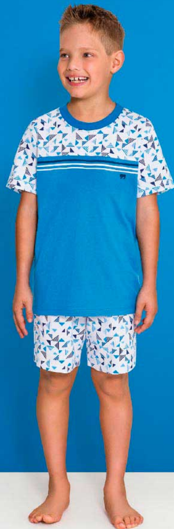
PIJAMA MM Ref. 11.01.0205 6 a 14 Anos Malha: 100% Algodão Cor: Azul / Marrom