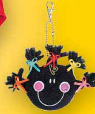
CHAVEIRO MEG Ref. 16.10.0013 Cor: Única