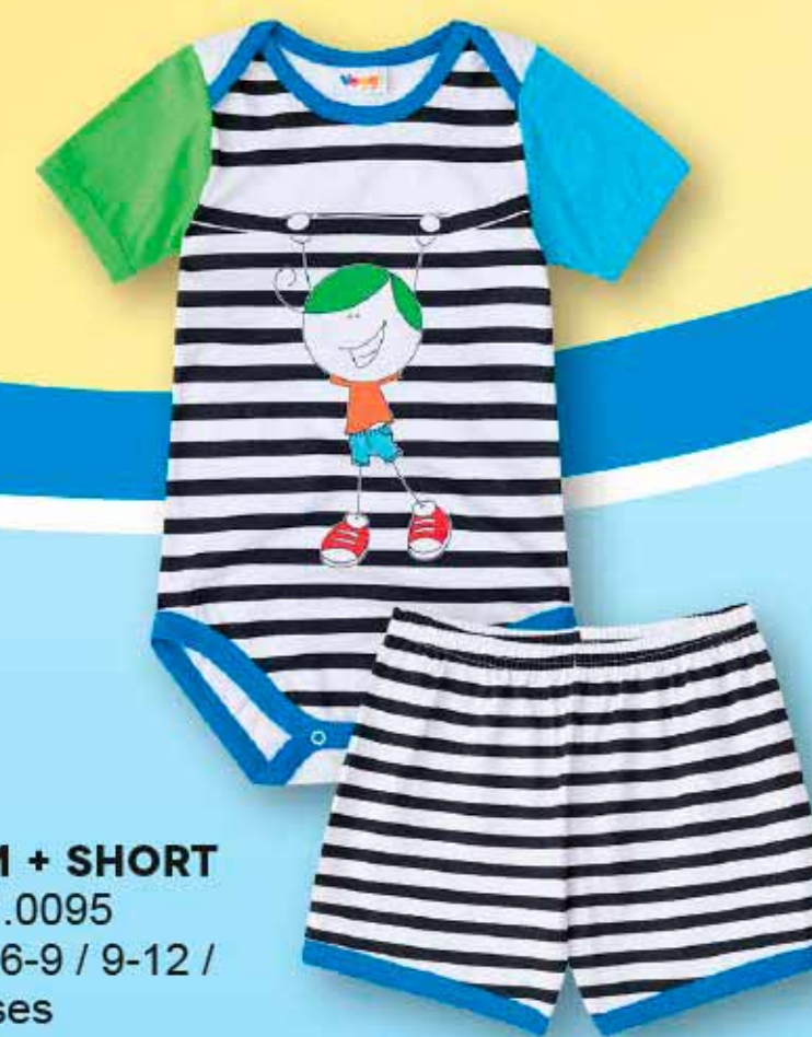
BODY MM + SHORT Ref. 13.01.0095 0-3 / 3-6 / 6-9 / 9-12 / 12-18 Meses Malha: 100% Algodão Cor: Única