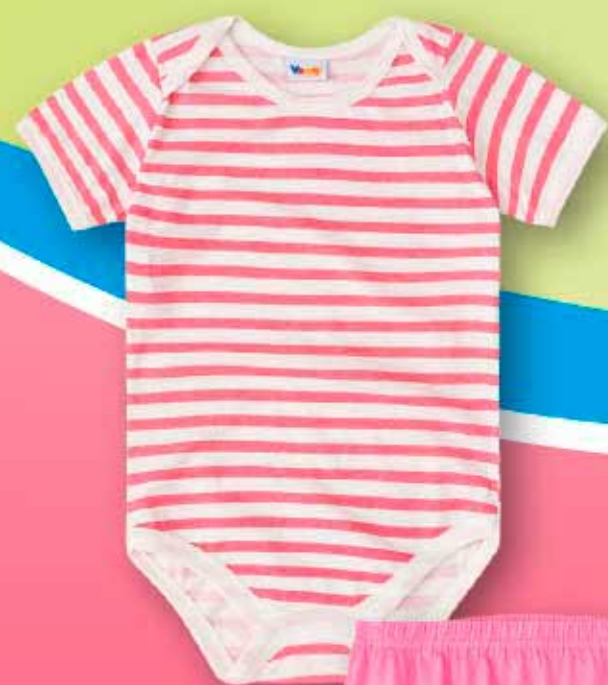
BODY MM + TAPA FRALDA Ref. 13.01.0093 0-3 / 3-6 / 6-9 / 9-12 / 12-18 Meses Malha: 100% Algodão Cor: Única