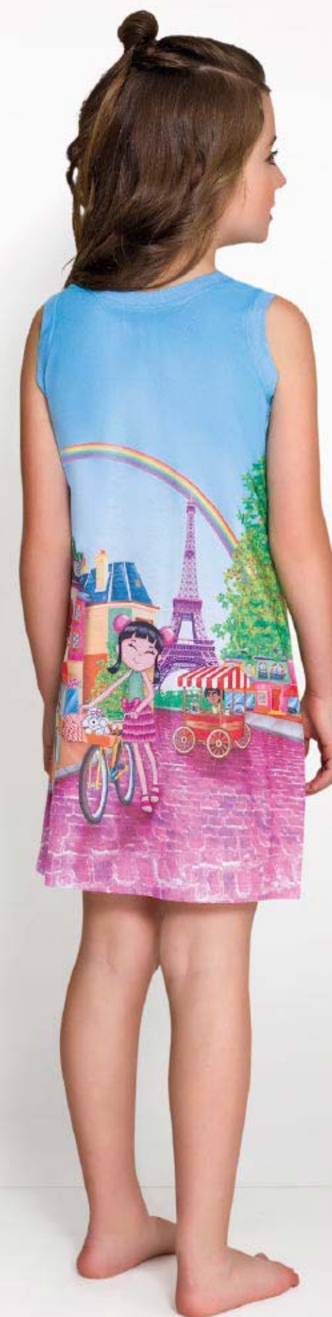
CAMISOLA REGATA Ref. 11.02.0075 6 a 14 Anos Poliéster Cor: Única