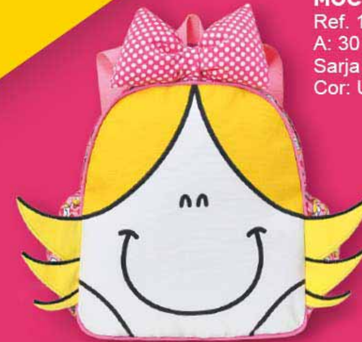
MOCILA Ref. 14.06.0011 A: 30 cm / L: 28 cm / P: 9 cm Sarja Algodão Cor: Única