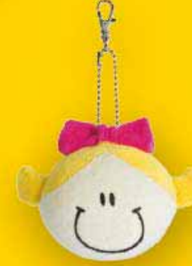
CHAVEIRO BIA Ref. 16.10.0011 Cor: Única