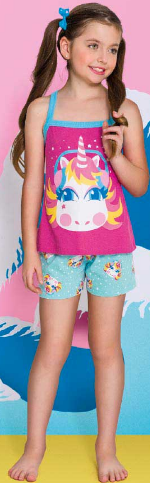
PIJAMA DE ALÇA Ref. 11.01.0195 6 a 14 Anos Malha: 100% Algodão Cor: Única