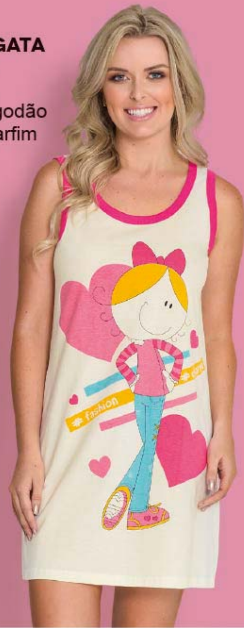
CAMISOLA MM Ref. 10.02.0180 PP ao XG Malha: 100% Algodão Cor: Branco / Marfim