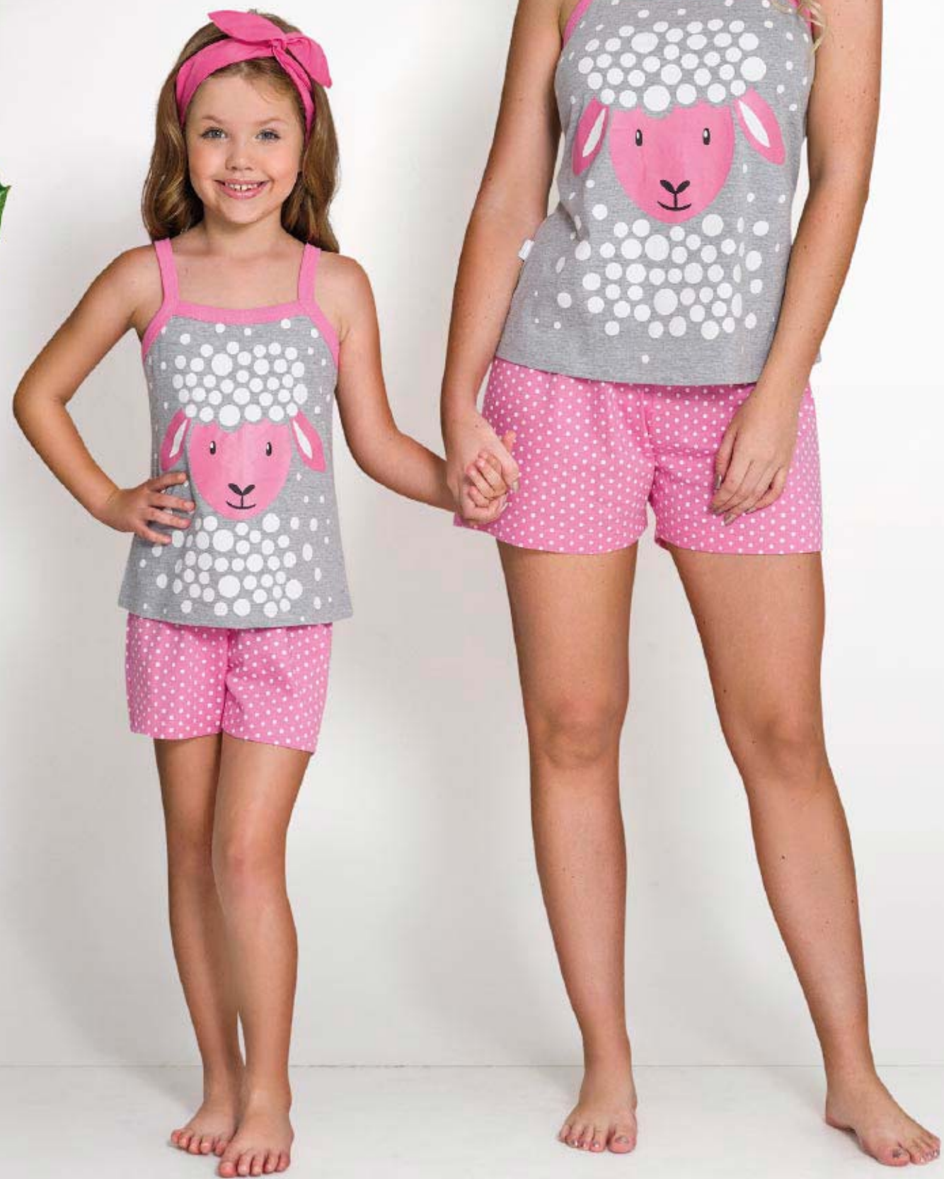
PIJAMA DE ALÇA Ref. 11.01.0181 6 a 14 Anos Malha: 100% Algodão e Mescla Cor: Única