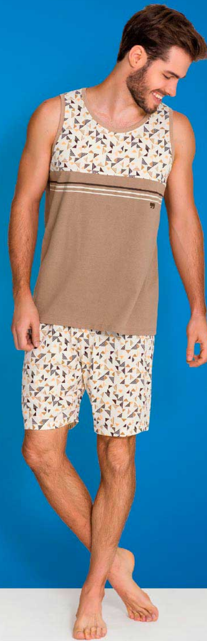
PIJAMA REGATA Ref. 10.01.0254 P ao XG Malha: 100% Algodão Cor: Azul / Marrom