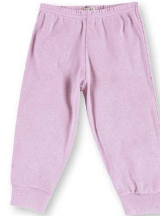
CALÇA KIT COM 2 Ref. 13.13.0003 Malha: 100% Algodão