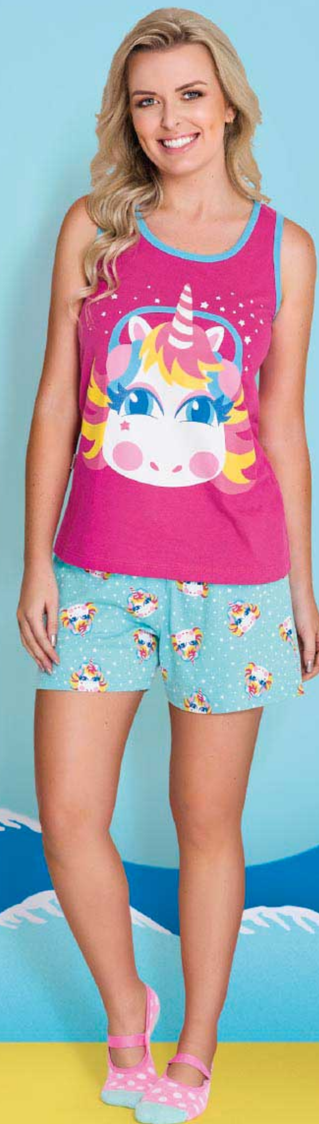
PIJAMA REGATA Ref. 10.01.0244 PP ao XG Malha: 100% Algodão Cor: Única