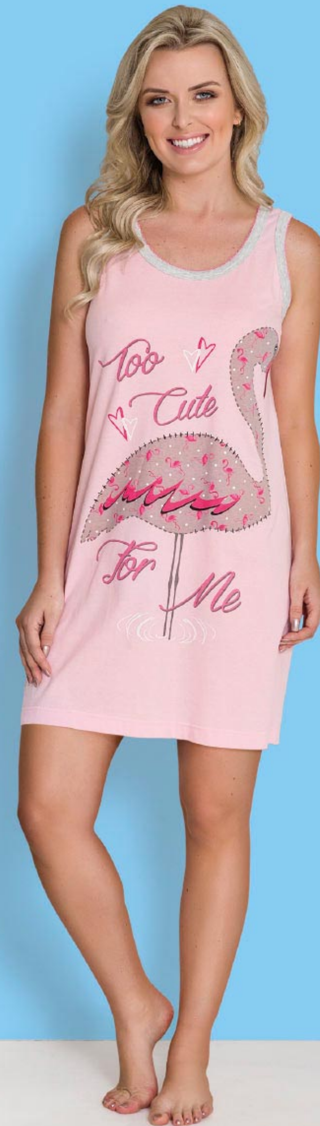
CAMISOLA REGATA Ref. 10.02.0186 PP ao XG Malha: 100% Algodão Cor: Única