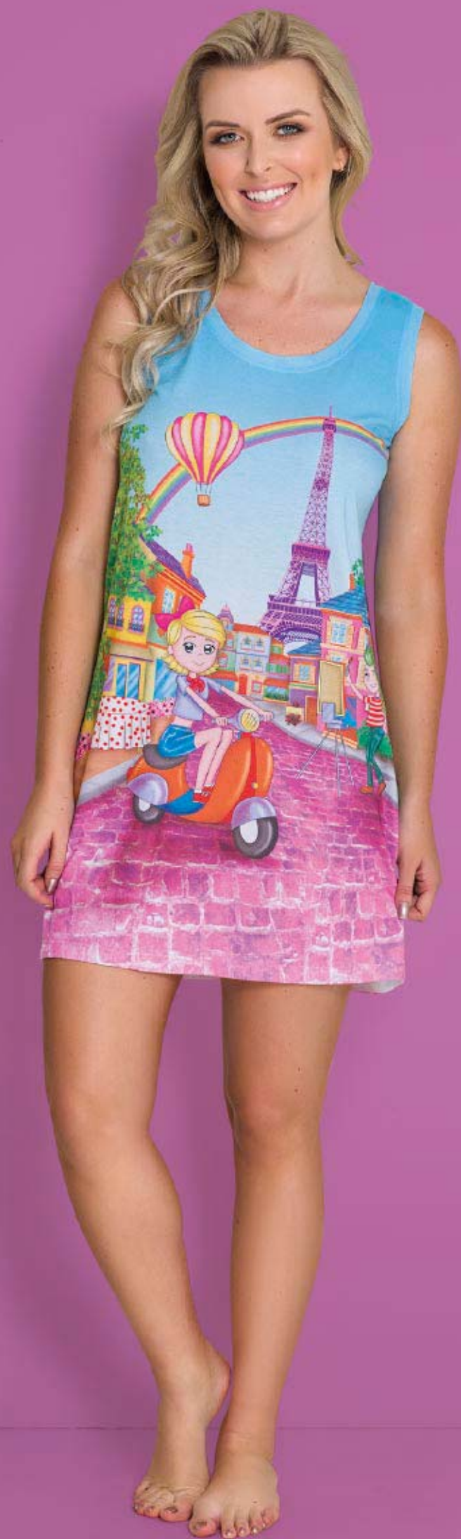
CAMISOLA REGATA Ref. 10.02.0187 PP ao XG Poliéster Cor: Única