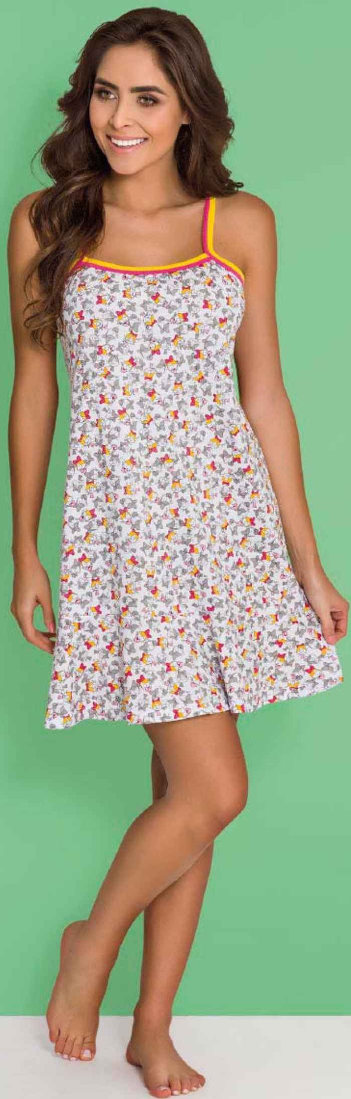
CAMISOLA DE ALÇA Ref. 10.02.0179 PP ao XG Malha: 100% Algodão Cor: Branco / Marfim