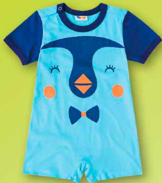
MACACÃO Ref. 13.04.0054 0-3 / 3-6 / 6-9 / 9-12 / 12-18 Meses Malha: 100% Algodão Cor: Única