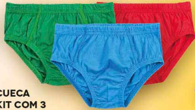
CUECA KIT COM 3 Ref. 12.04.0020 Kids Plus: 2 a 10 anos Malha: 100% Algodão Cor: Sortidas