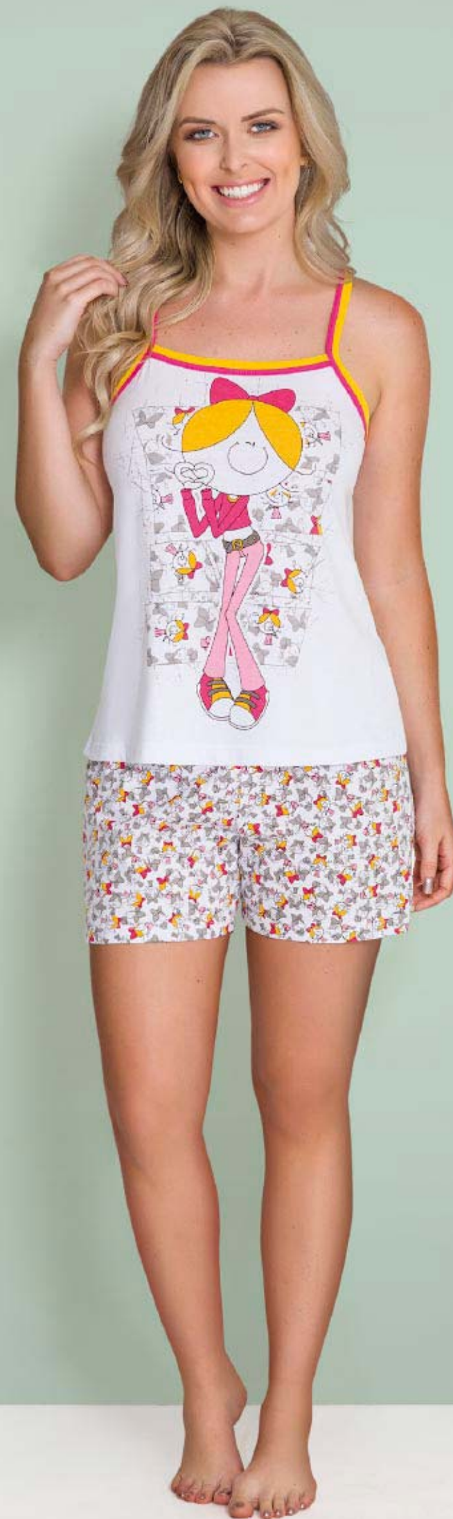
PIJAMA DE ALÇA Ref. 10.01.0239 PP ao XG Malha: 100% Algodão Cor: Branco / Marfim