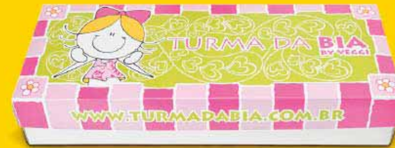
CAIXA EMBALAGEM Ref. 16.04.0036 A: 13 cm / L: 33 cm / P: 06 cm Cor: Única Kit com 10