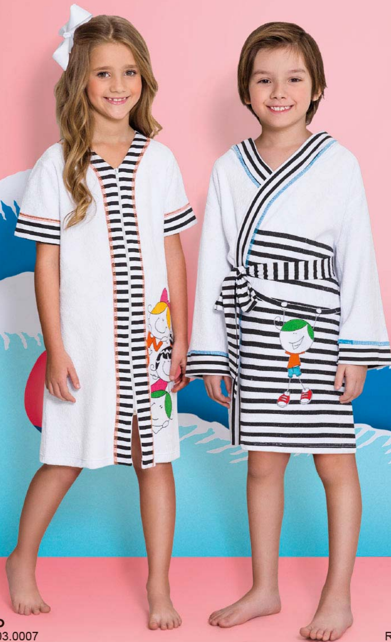
ROUPÃO Ref. 11.03.0007 6 a 14 Anos Malha: Atoalhada Cor: Única