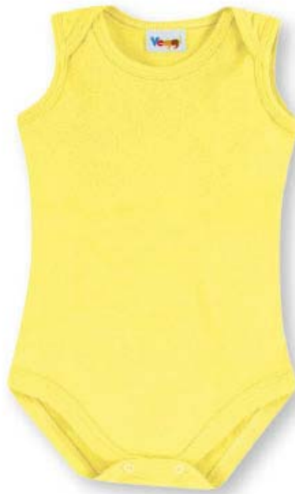
BODY REGATA KIT COM 2 Ref. 13.05.0051 Malha: 100% Algodão