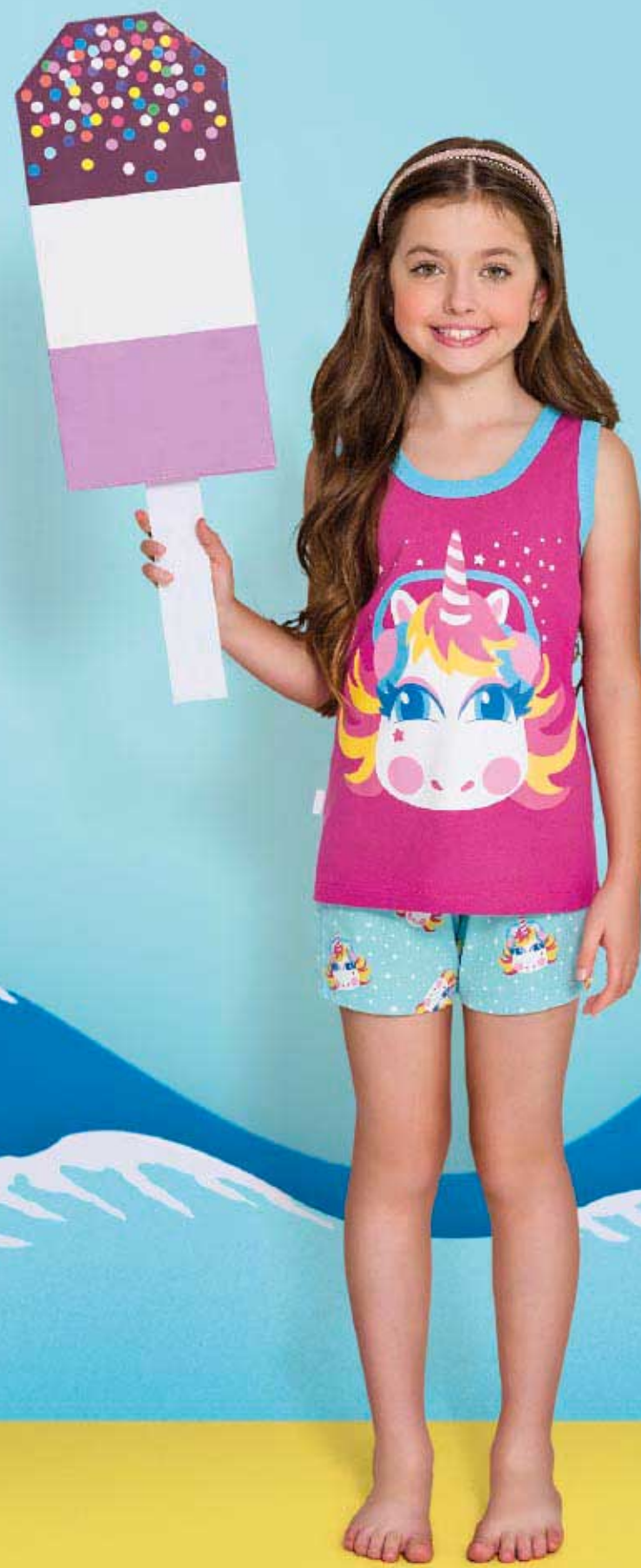
PIJAMA REGATA Ref. 11.01.0197 6 a 14 Anos Malha: 100% Algodão Cor: Única