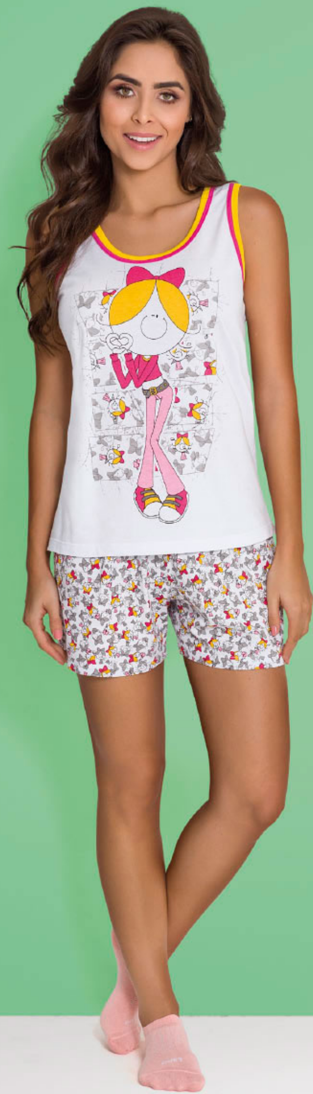
PIJAMA REGATA Ref. 10.01.0234 PP ao XG Malha: 100% Algodão Cor: Branco / Marfim