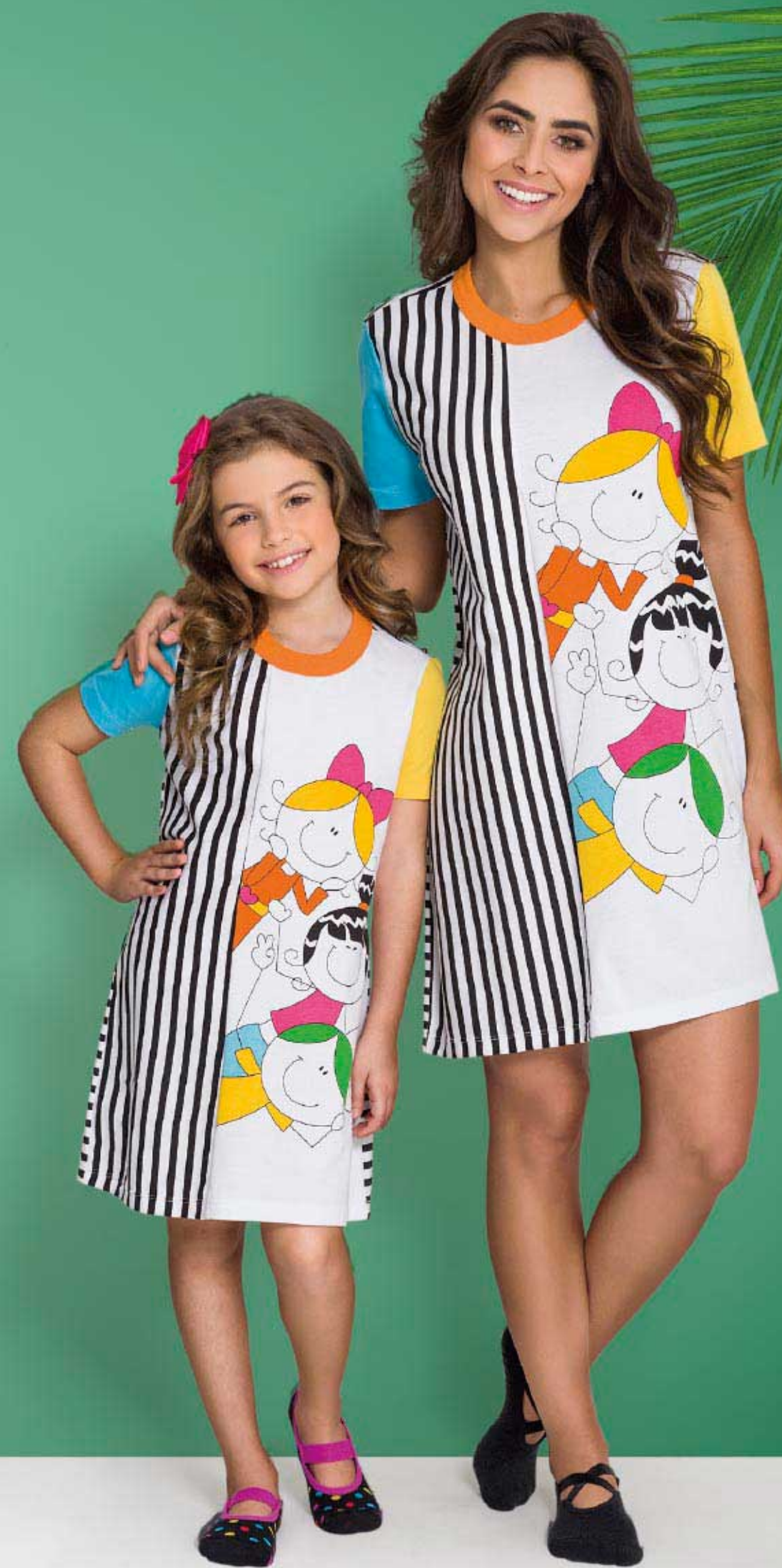
CAMISOLA MM Ref. 11.02.0068 6 a 14 Anos Malha: 100% Algodão Cor: Única