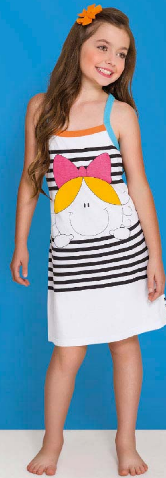
CAMISOLA DE ALÇA Ref. 11.02.0069 6 a 14 Anos Malha: 100% Algodão Cor: Única