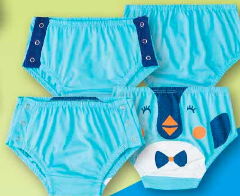
TAPA FRALDA KIT COM 2 Ref. 13.04.0058 0-3 / 3-6 / 6-9 / 9-12 / 12-18 Meses Malha: 100% Algodão Cor: Única