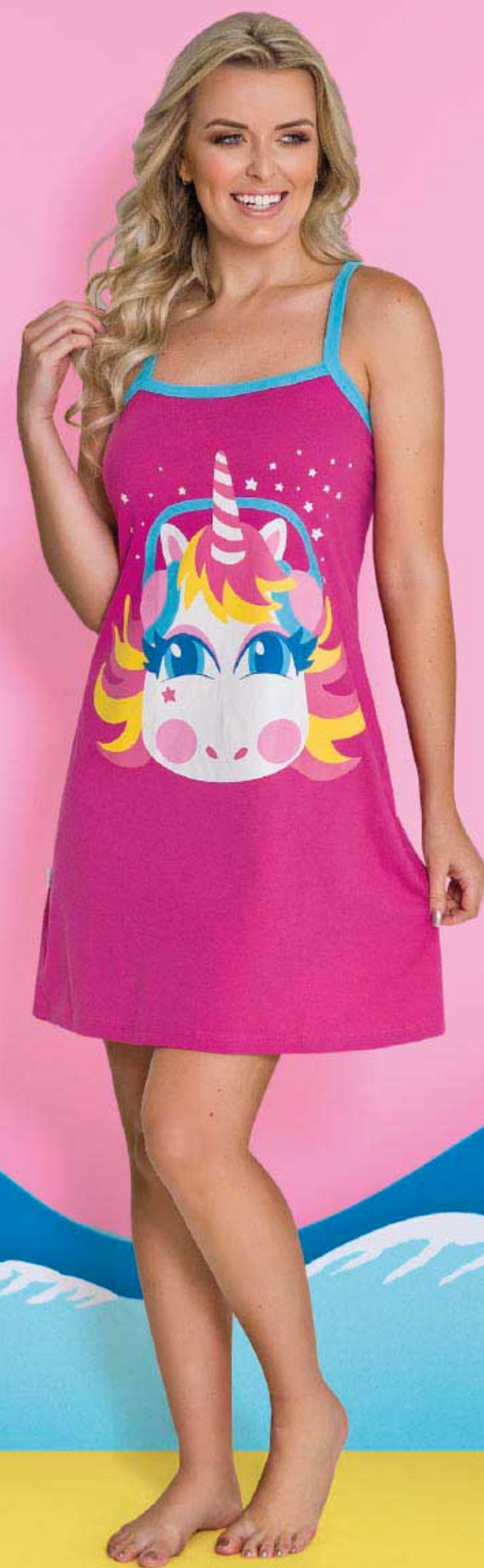
CAMISOLA DE ALÇA Ref. 10.02.0183 PP ao XG Malha: 100% Algodão Cor: Única