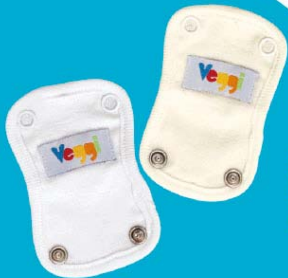
EXTENSOR DE BODY Ref. 13.04.0011 Ribana Cor: Branco / Marfim

Tamanhos: 0-3 | 3-6 | 6-9 | 9-12 12-18 Meses