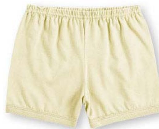
SHORT KIT COM 2 Ref. 13.13.0002 Malha: 100% Algodão