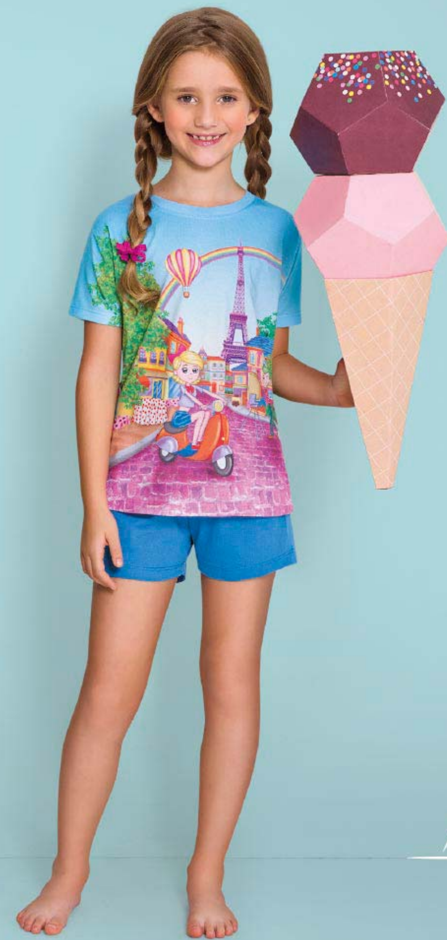
PIJAMA MM Ref. 11.01.0201 6 a 14 Anos Blusa Poliéster / Short Algodão Cor: Única