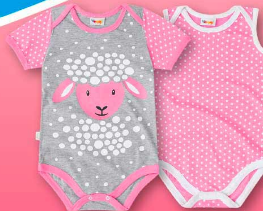
BODY KIT COM 2 Ref. 13.05.0075 0-3 / 3-6 / 6-9 / 9-12 / 12-18 Meses Malha: 100% Algodão e Mescla Cor: Única