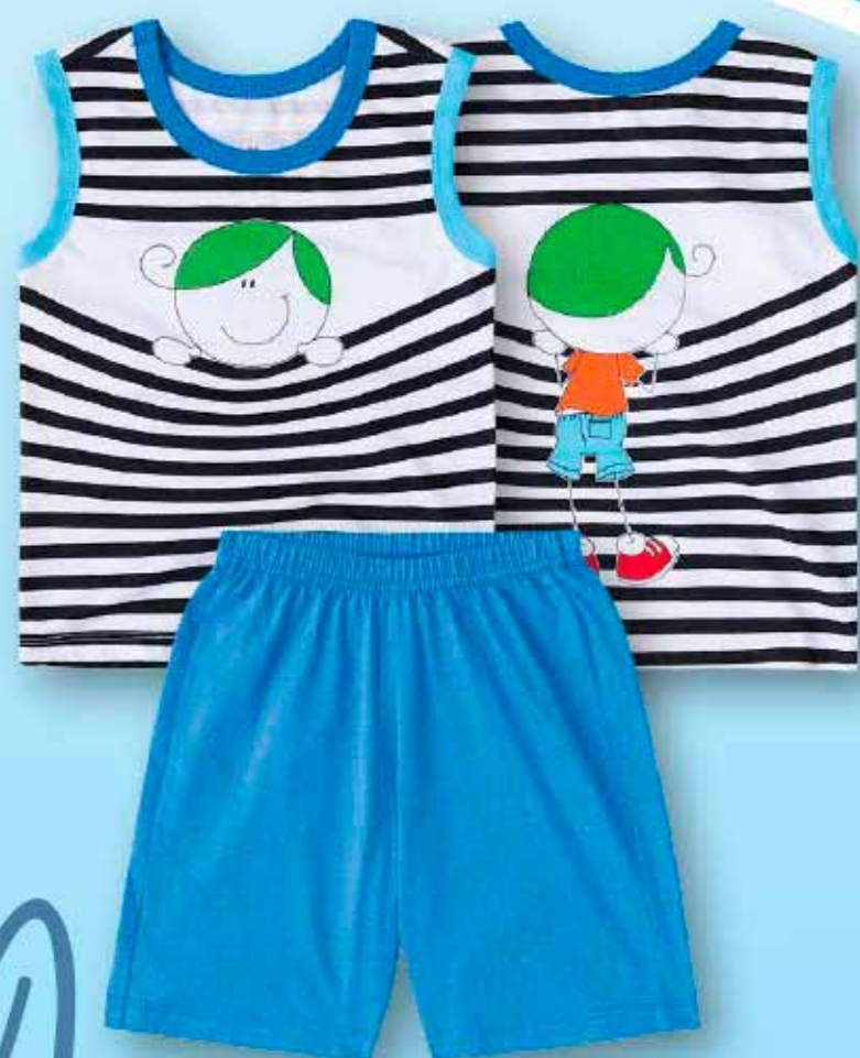
PIJAMA REGATA Ref. 12.01.0184 2 a 5 Anos Malha: 100% Algodão Cor: Única